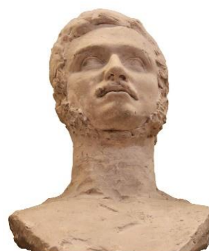
Odlew głowy poety Krasińskiego Z.