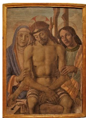
Chrystus Frasobliwy - Fiorentino

Oprócz różnych rzeźb oglądamy też malarzy ze szkoły Giotta z 13 -14 wieku, malarstwo renesansowe, kościelne i świeckie. Najwcześniej, rozkwitło we Włoszech.