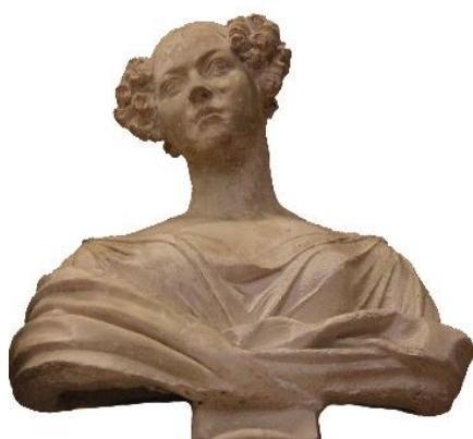
Ewelina z Rzewuskich Hańska - miłość Balzaka

Galeria Akademii posiada też salę odlewów, kopii różnych rzeźb.