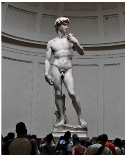
Dawid (1501-1504) Michała Anioła

Poprzednio zaprosiłem Państwa do florenckiego Palazzo Pitti, by obcować z pięknem Renesansu. Pozostaniemy jeszcze we Florencji. Dziś zapraszam do Accademia Gallery, na krótką wizytę, gdzie także poszukiwaliśmy „poloniców”. 1 Słynna rzeźba Michała Anioła „Dawid” poraża swym pięknem i perfekcją wykonania. Przedtem wielcy rzeźbiarze, jak Verrochio, Ghiberti czy Donatello przedstawiali biblijnego Dawida po walce, a jego noga tryumfalnie spoczywała na głowie Goliata. A Michał Anioł, pracując nad rzeźbą ponad dwa lata, miał odwagę przedstawić go inaczej. Dawid jest przed walką z Goliatem i wydaje się zrelaksowany, spokojny, choć patrzy przenikliwie na przeciwnika.