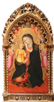
Dziewica i 6 aniołów - Gaddi