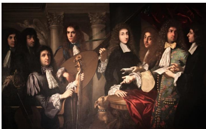
Książę Ferdynand - drugi z prawej - Domenico Gabbiani

Miał też swoją orkiestrę, w której grał. Uwielbiał instrumenty i pozostawił po sobie dużą kolekcję różnych instrumentów muzycznych.