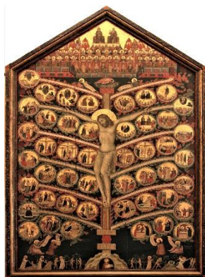
Drzewo życia - P. Buonaguida