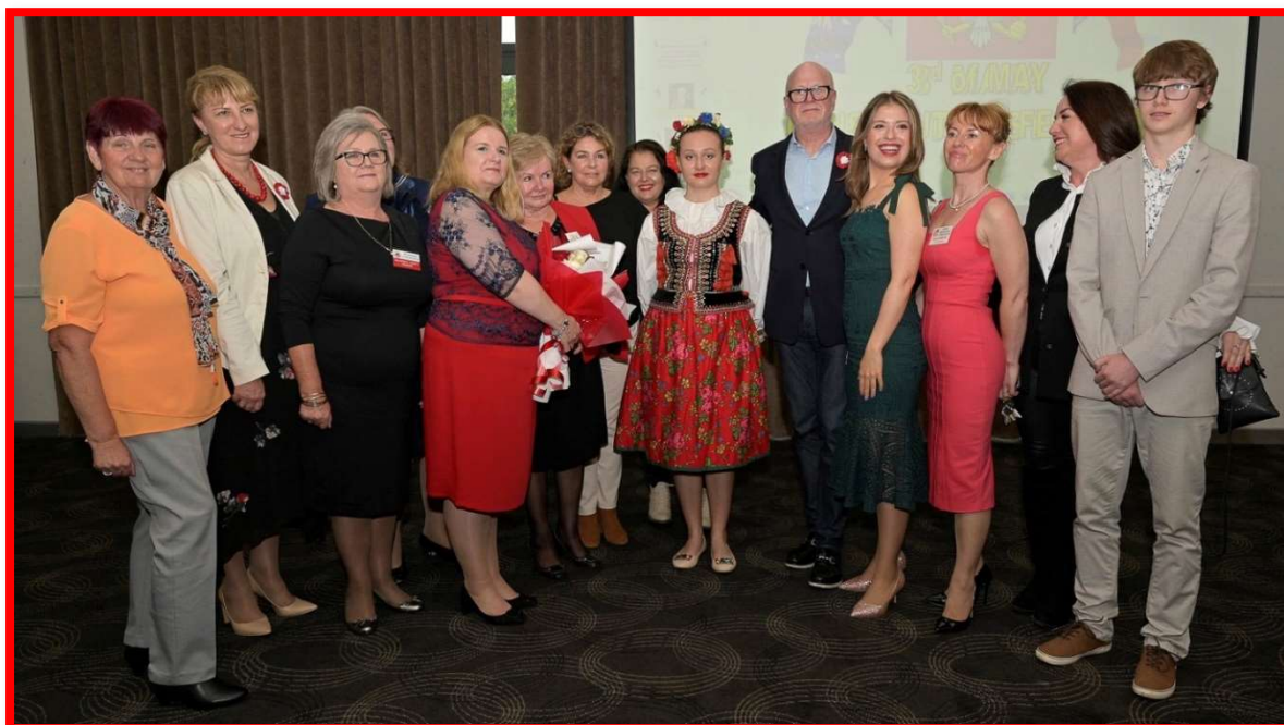
Organizatorzy i uczestnicy Akademii z okazji uchwalenia Konstytucji 3 Maja