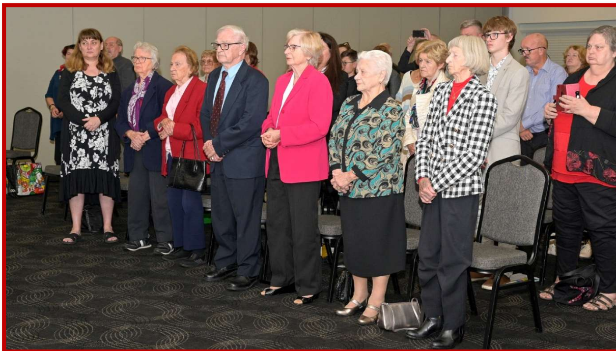
Sybiracy przed dekoracją Krzyżami Zesłańców Sybiru