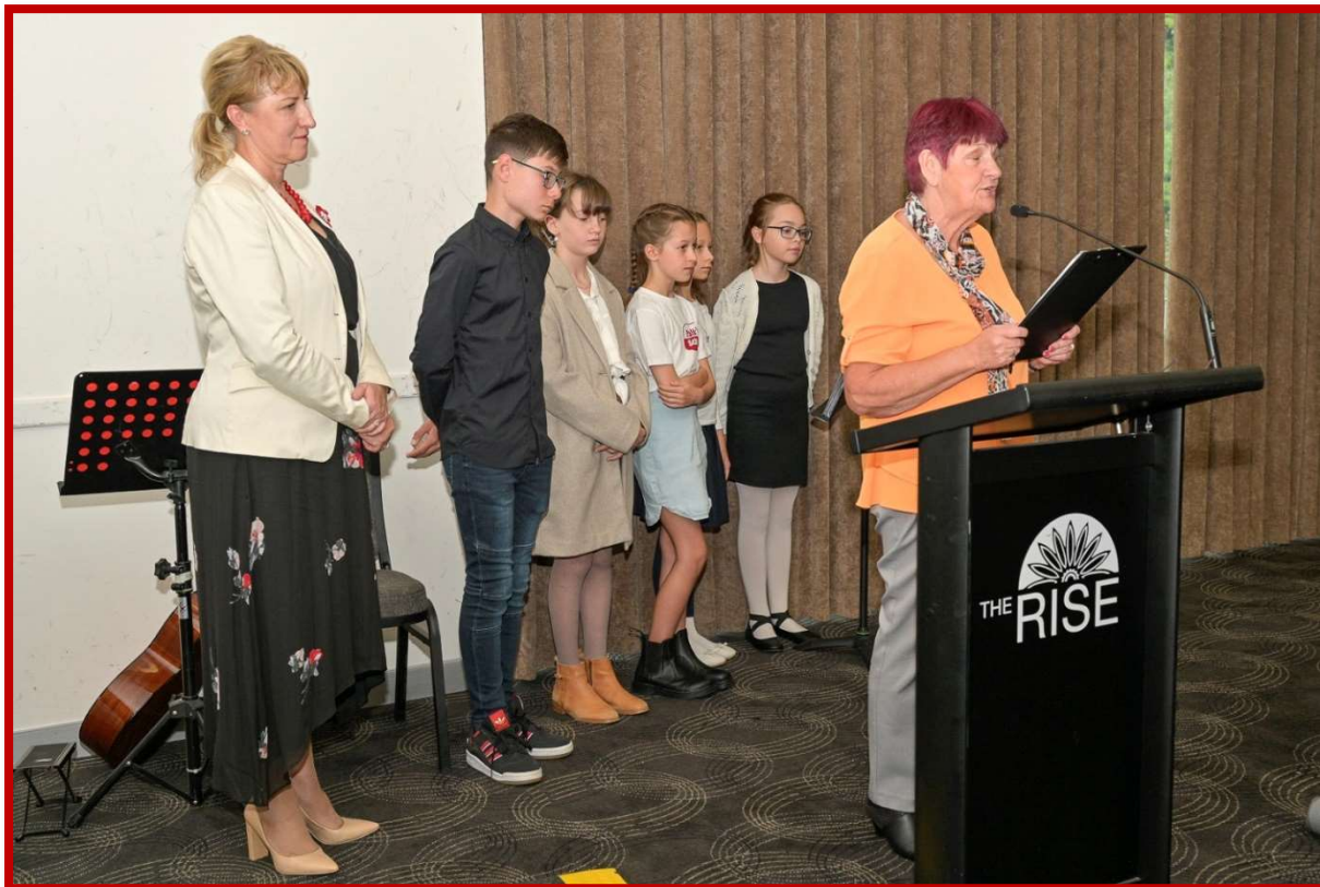
Występujący z Polskiej Szkoły z Zachodniej Australii z Wembley