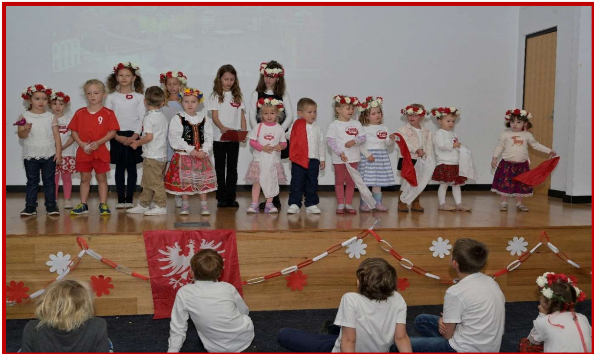
Występy dzieci w Polskiej Szkole w Zachodniej Australii

Jesteś Polakiem z dziada pradziada I w tobie polskie bije serduszko. Twoja Ojczyzna – jest krajem prawa, w nim żyje prawa i dumna ludzkość.