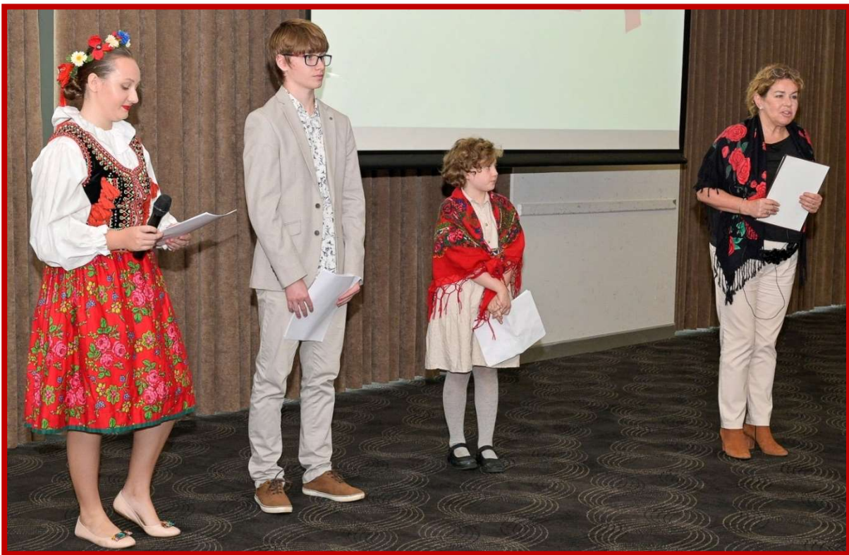
Występujący z Polskiej Szkoły im. A. Mickiewicza z Maylands

Niżej galeria zdjęć z uroczystości niedzielnych 7 maja 2023