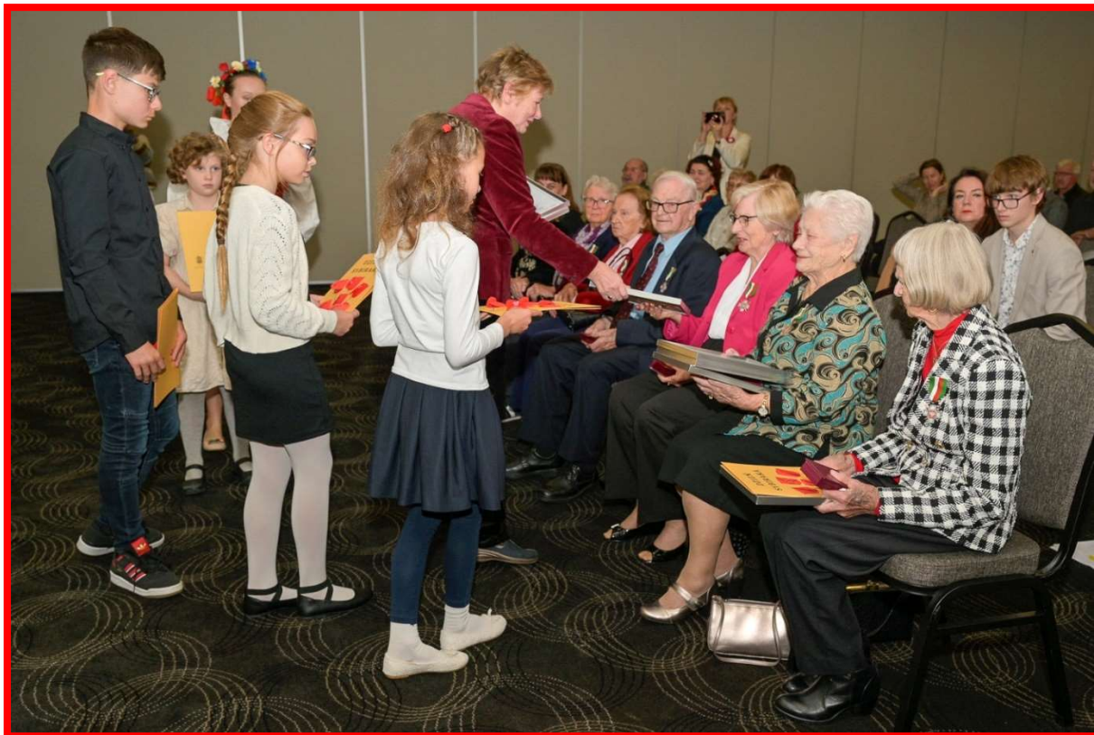
Sybiracy otrzymali również opracione wiersze i laurki