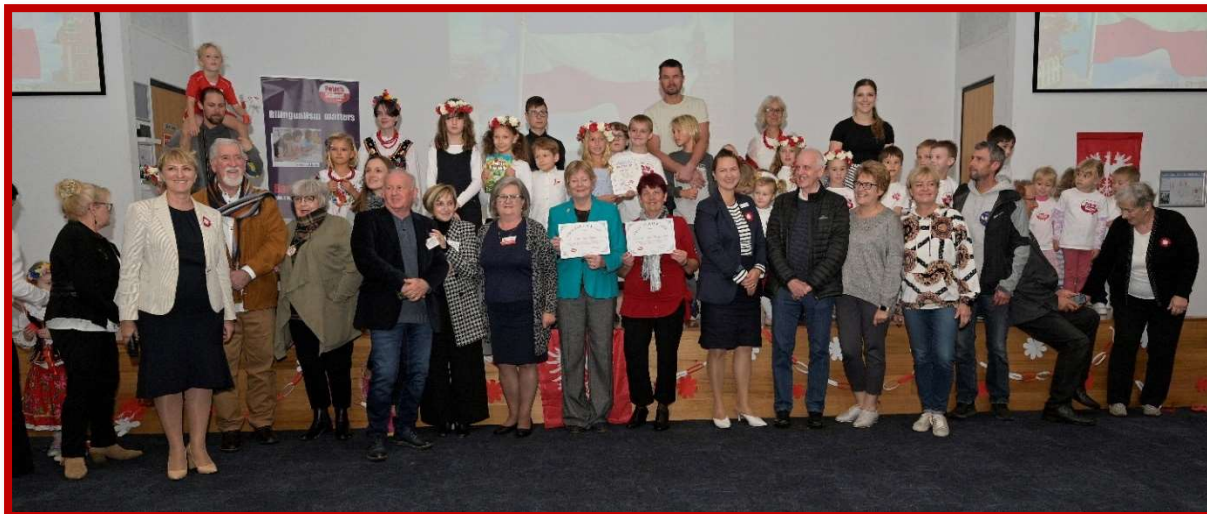
Uczestnicy uroczystego apelu w Polskiej Szkole w Wembley