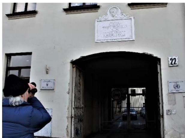
Tablica z napisem, że z tego domu Mickiewicz wyjechał na zsyłkę opuszczając Wilno na zawsze

Niestety, poeta do ojczyzny już nie wrócił.