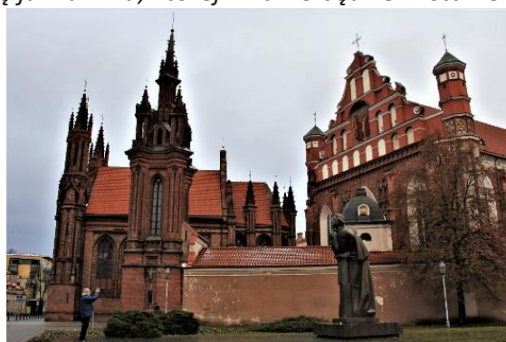
Kościół św. Anny i monumentalny pomnik poety