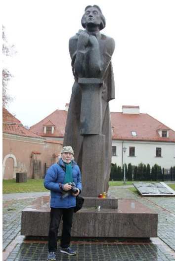
Autor przed Mickiewiczem

Można się domyślać, że w tym okresie cenzura mogła wykreślić takie zdania jak: