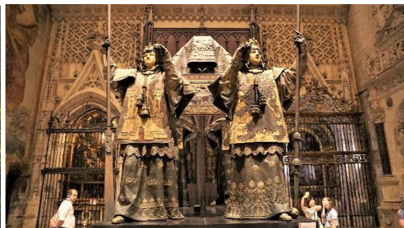
Sarkofag Krzysztofa Kolumba w katedrze NMP, Sewilla

Po zwiedzeniu Pałacu Alkazar, przechadzając się w słońcu po pięknych ogrodach, fotografując królewskie pawie i popijając wodę skierowaliśmy swoje kroki do pobliskiej katedry, by zobaczyć sarkofag Kolumba, nad którego pochodzeniem do tej pory zastanawiają się badacze.