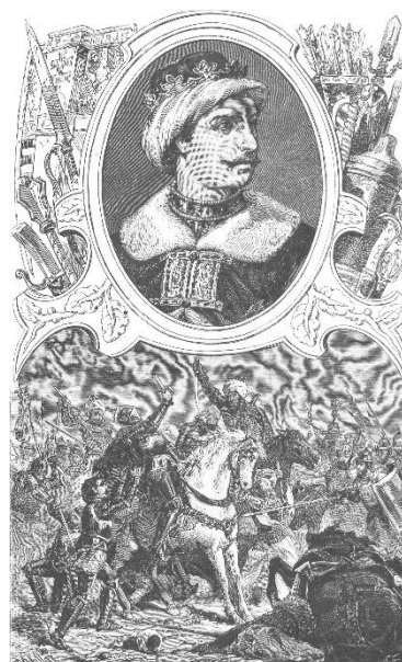
Władysław III Warneńczyk

Wojskami krzyżowców, składających się głównie z żołnierzy węgierskich, polskich, Bohemii i innych krajów europejskich przeciwko wojskom osmańskim sułtana Murada II, dowodził właśnie król Węgier i Polski Władysław III.