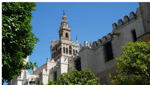
Fragment katedry Najświętszej Marii Panny, Sewilla

Tu także królowa Izabella i Ferdynand II Aragoński przyjmowali Krzysztofa Kolumba po zakończonej wyprawie do Ameryki.